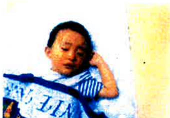
ママの夢みてるよ

寝てしまったお子様は 一人一人の姿に感動が 日々を迷わせて頂いて います。 体調をくずす時期 でもありますので お子様の体調維持 に十分気を付けて いきたいと思ひます。 左の写真は ある日のひとこまで