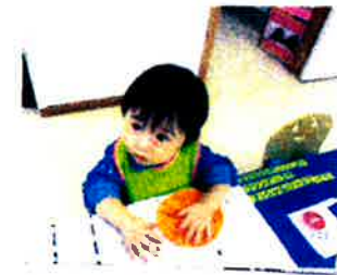
おおいにかきたよ