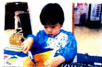
こうしてかくとかきやすだよ