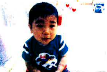
LIMITINにみている、自分の前に いるはおもたちでした。