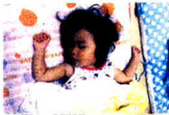
ネジちゃん、がんばるかな