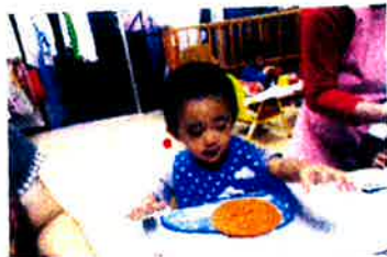
マジックあかかして