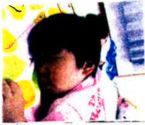
おきたらなにしておぼろかな