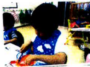
2つのマジックつかってしるよ