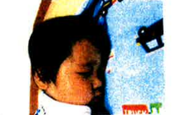
トーマスの夢みてるんだ