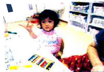
それ かきでしよう