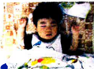
マンパンマンとあついているよ